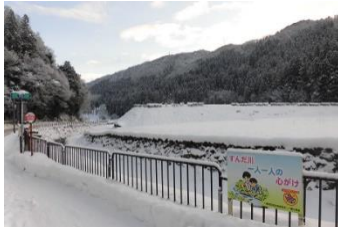
<雪の日の学校前の様子>

ここ数日は、三寒四温とまではいかないかもしれませんが、温かい日と、とても寒い日がかくかえされています。春がもうそこまで近づいてきているように感じます。