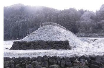
<上城戸も凍る寒い朝>

今冬は、まだ積雪はありませんが、氷点下になることもあり、見守り隊の皆様と一緒に登校していただくことに感謝しかありません。学校では、登校指導や交通安全、更には不審者が出た場合についても日頃から学習の機会を設けていますが、やはり大人の方が近くに来てくださるだけで、とても心強く感じます。今後ともよろしくお願いします。