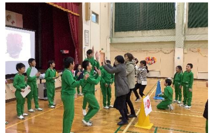
6年生とハイタッチ!