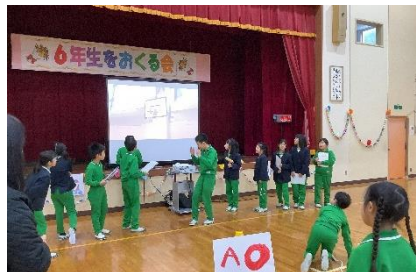
思い出いっぱいおもしろクイズ