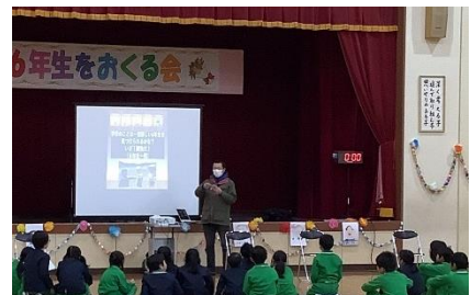
保護者サプライズ企画