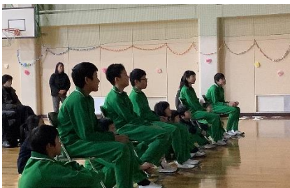
思い出 Movie タイム