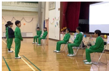
5年生から贈る言葉