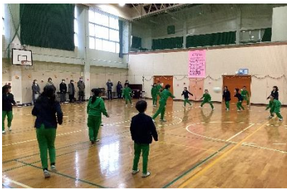
思い出ドッジボール

6年生と過ごす日もあと12日となります。1日1日を大切に毎日を送っていきましょう。